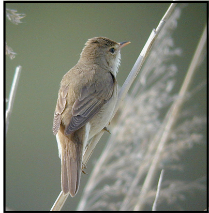
Kärrsångare ( Acrocephalus palustris ) Marsh Warbler.

Denna art är ingen sångare utan en trastfågel. Näktergalen uppträder i miljöer som liknar busksångarens men också i parker och lundar. Den förekommer vid flera av de lokaler vi besöker på nattfågelutflykten, vid Granskär, Ålsjön, Britas backe etc. Sången är välkänd, stark och smäktande med visslingar, sträva läten och drillar: ”Ka-tjuck, ka-tjuck, ka-tjuck, kr-kr-kr, sju-sju-sju, kara-terrrrrr-sju!”