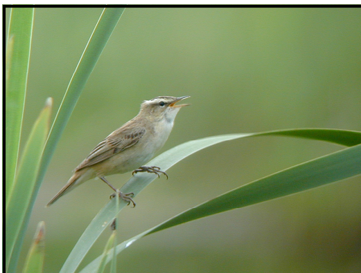
Sävsångare ( Acrocephalus schoenobaenus ) Sedge Warbler.

En av våra vanligaste sångare i släktet acrocephalus , förekommer i våtmarker som exempelvis Granskär. Sången är aktiv, nästan hetsig och ganska högljudd. Den framförs i långa fraser av upprepade skorrande läten som blandas med vassa härmljud och visslingar. ”Kri-kra-kri-kra-kerri-sju-kerri-kerri-kra-sju” etc.