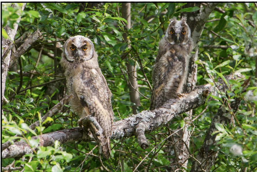
Hornuggla ( Asio otus ) Long-eared Owl.

Det säger väl sig självt att de fåglar vi presenterar är nattaktiva. Långt ifrån alla hör dock till släktet sångare, vi tar upp de arter som man har störst chans att få höra, eller i bästa fall se, under en tur under de ljusaste sommarveckorna.