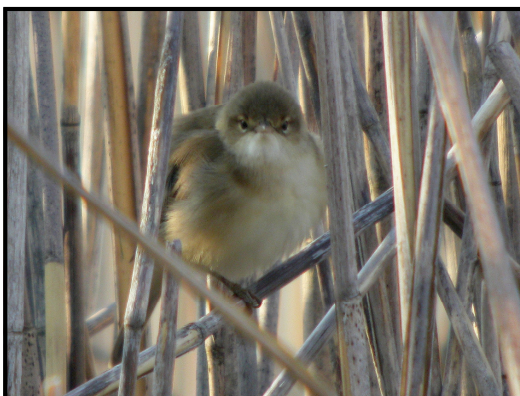
Rörsångare ( Acrocephalus scirpaceus ) European Reed Warbler.

Ibland lägger busksångaren in ett smackande lockläte innan den går vidare med nästa art. Rösten förefaller inte så ljus som kärrsångarens.