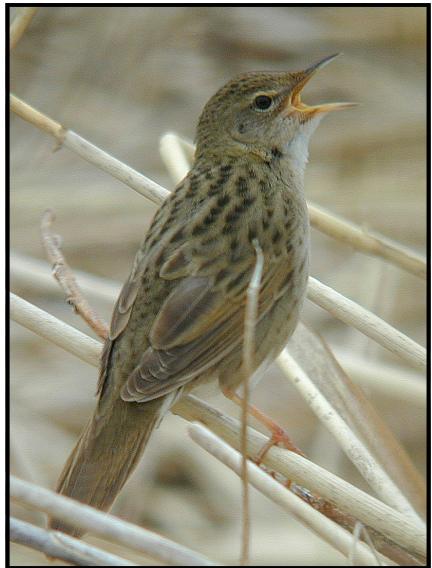
Gräshoppsångare ( Locustella naevia ) Common Grasshopper Warbler.